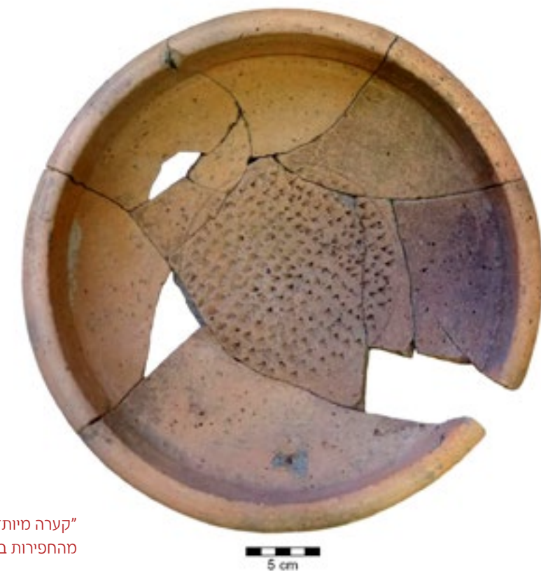
"קערה מיוחדת" מהחפירות במראס א-דין

בהרצאה נתאר את הרקע ההיסטורי והארכיאולוגי של מזרח השומרון בתקופה שאחרי הכיבוש האשורי של ממלכת ישראל, ונציג את התוצאות הראשוניות של חפירת הבדיקה שבוצעה באפריל 2017.