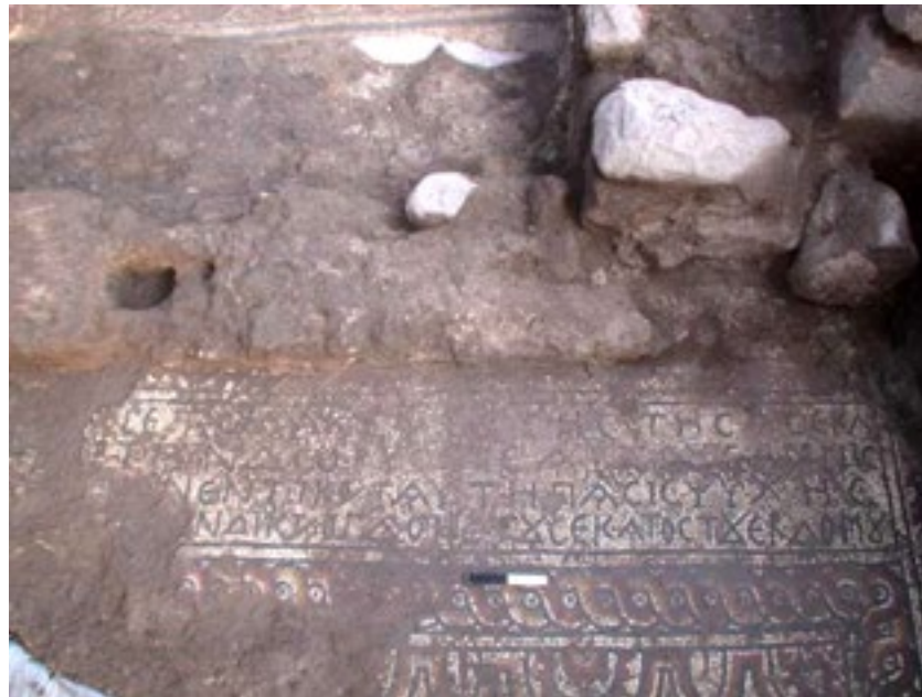
טמרה - כתובת הקדשה ביוונית ברצפת הכנסייה, מתוארכת לשנת 107 להיג'רה; שנת 725 לסה"נ (יותם ספר 2013)

בהרצאה נציג ממצאים נוספים, היכולים לדעתנו לשפוך אור חדש על האתרים ותושביהם באותה העת וכן גם פרשנות נוספת לממצא הארכיאולוגי. מכאן, צפויה להערכתנו תרומה לדין במעבר ההיסטורי הנדון כאן במרחב הכפרי בארץ ישראל.