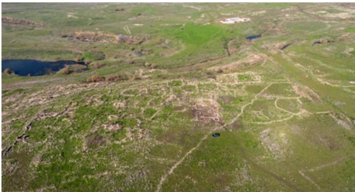
ח' מג'דוליה.

בשנים האחרונות מתקיימת חפירה ארכיאולוגית באתר חורבת מג'דוליה הממוקמת בגבול הצפוני של תחום סוסיתא מעל הגדה הדרומית של נחל סמך. העדויות הארכיאולוגיות באתר שופכות אור על הגבול הצפוני של תחום סוסיתא ועל המשמעות של הגבול בחיי היום-יום. עד כה אין זיהוי לשמו הערבי של האתר שניתן לקושרו עם שם מהעת העתיקה. הכפר מתוארך לתקופה הרומית (עדות מצומצמת ליישובו מחדש קיימת בימי הביניים). מטרתן של החפירות הן לאפיין את טיבה של התרבות החומרית של יישוב כפרי בגולן במהלך התקופה הרומית ולעמוד על אופי הקשרים עם אתרים אחרים בסביבה. בצד הדרומי-מזרחי של האתר התגלה בית כנסת מהתקופה הרומית, עדות ליישוב היהודי במקום. מצפון-מזרח לבית הכנסת, בקצה הכפר התגלה כבשן לייצור כלי חרס. מחקר כלי החרס שנוצרו במג'דוליה מעלה מספר שאלות יסוד לגבי הקשר עם אתרים אחרים באזור ובראש ובראשונה עם עיר האם במרחב - הפוליס אנטיוכיה היפוס (סוסיתא).