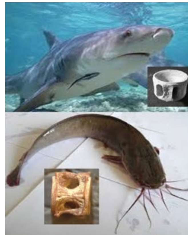
למעלה: כריש, למטה: שפמנון מצוי

על מנת לענות על השאלה "מתי החלו בני ישראל להימנע מאכילת שפמנונים ודגי סחוס" אספנו נתונים על שכיחות שרידיהם באתרים שונים ובתקופות שונות. תוצאות ראשוניות של מחקר זה מראות הבדל משמעותי בשכיחות שרידי דגים לא כשרים ברחבי הארץ בתקופת הברזל לעומת התקופה הרומית הקדומה (שלהי ימי הבית השני), ובמיוחד בירושלים. לפיכך אנחנו מציעים שהנהוג להימנע מאכילת דגים שאינם כשרים התפתח כנראה מאוחר יחסית, לכל המוקדם במהלך התקופה הפרסית ואולי רק בתקופה ההלניסטית.