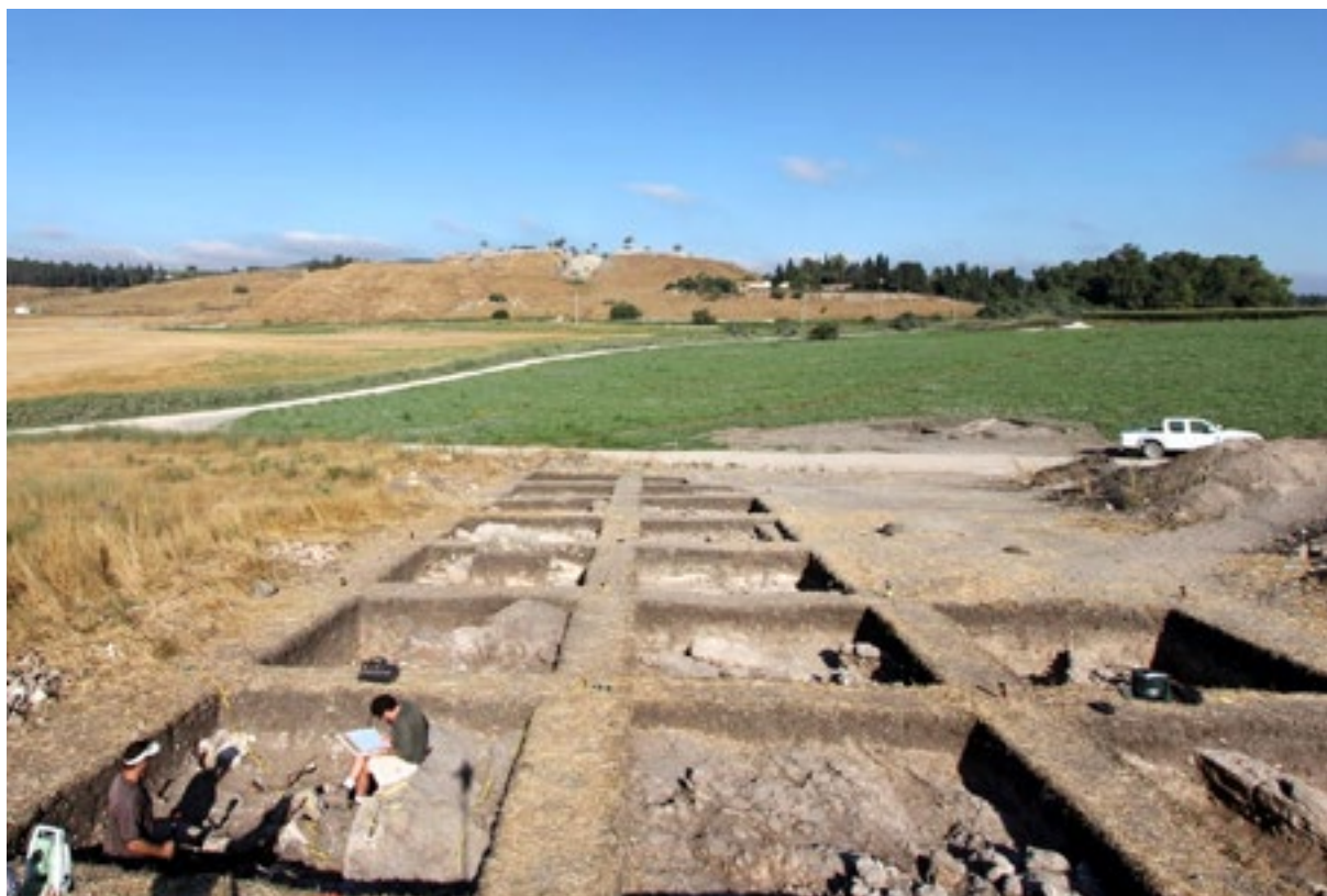
חפירות מגידו מזרח: מבט לכיוון תל מגידו

בהרצאה זו אנו נציג את מכלול כלי האבן מתל מגידו מזרח, ונשתמש בו על מנת להבין טוב יותר את האתר. אנו נבחן אם מכלול כלי אבן זה יכול לסייע להבהיר את היחסים בין תל מגידו מזרח לבין הפעילות הפולחנית שהתרחשה במקדש הגדול והמתוכנן של תקופת הברונזה הקדומה א' שהיה במרחק של מאות מטרים ספורים באקרופוליס של תל מגידו.