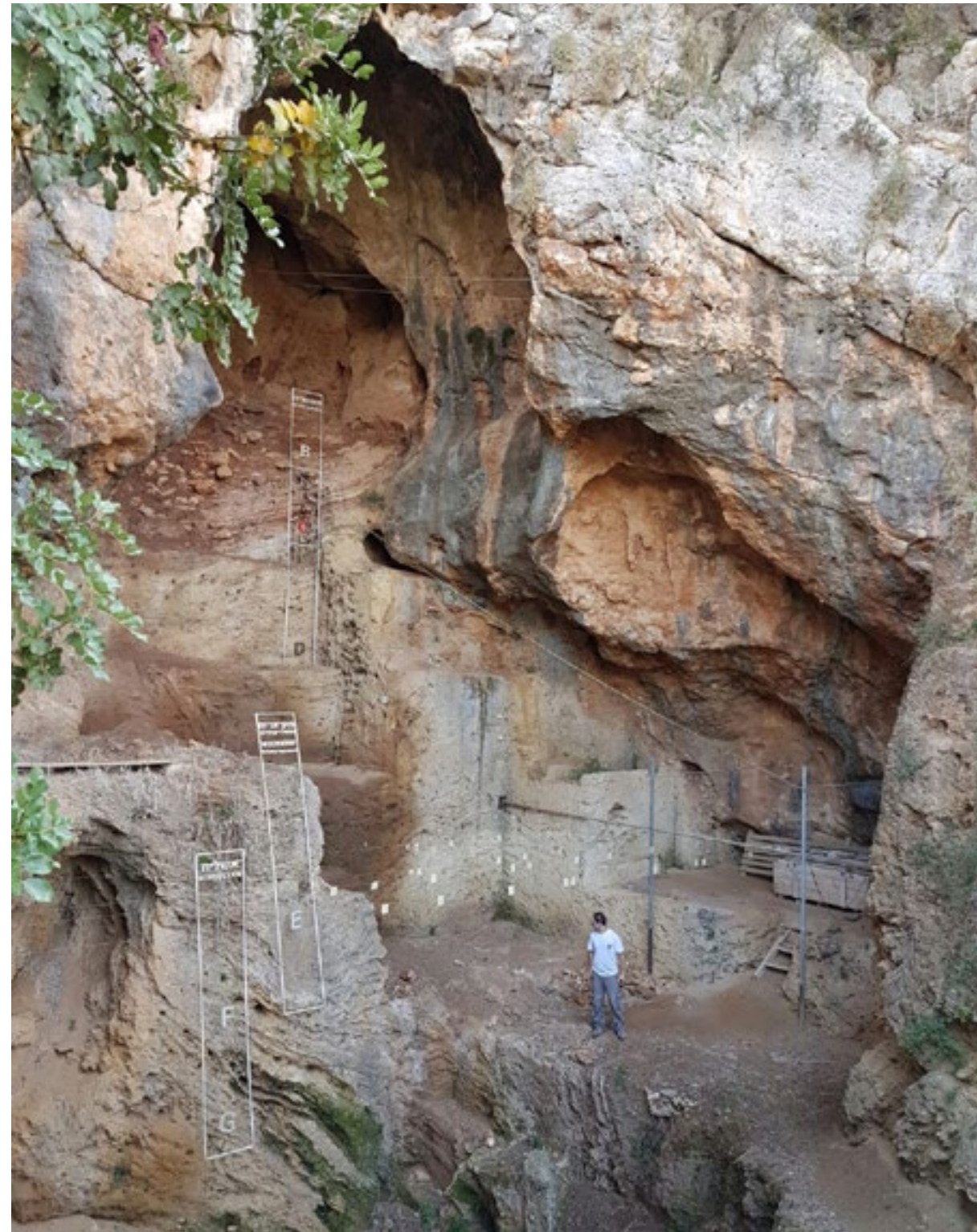
תמונה: חפירות שכבה B בטבון; מבט מן הארובה

המכון לארכיאולוגיה ע"ש זימן, אוניברסיטת חיפה