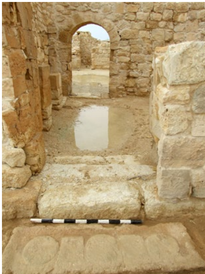
שבטה - משקוף מעוטר בכתובת יוונית כמדרגה בכניסה לבית הברכה